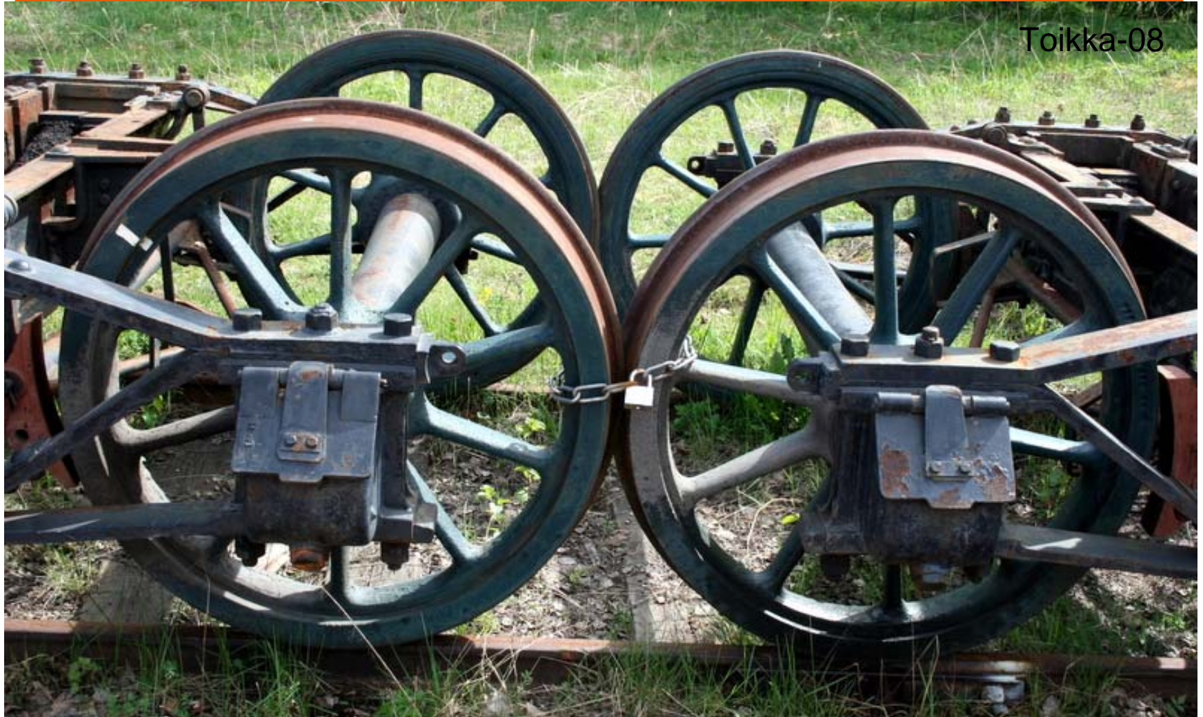
Lavaus 2008/ Toikka