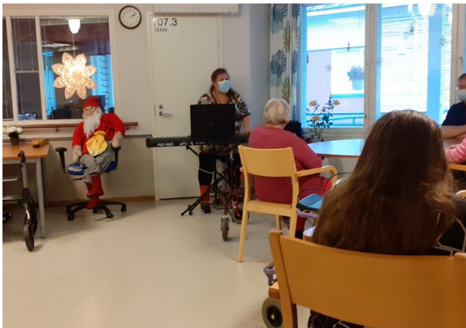
Kuva 2: Sumiaiskodin Tonttu muistaa lapsuudestaan, kuinka äiti lauloi Tuu tuu tupakkirullaa.

Residenssin tuotoksina syntyi muistisairautta käsittelevä laulu ”Sydän tuntee” ja yksikön maskotin, ”Tontun” elämää käsittelevä musiikillinen, osallistava prosessidraama. Tuotokset esiteltiin loppujuhlassa 5.11, johon osallistuivat kaikki yksikön asukkaat, vuorossa olevat työntekijät sekä yksikön johtaja Sirpa Halla-aho. Yhteisö osallistui juhlan valmisteluihin mm. leipomalla täytekakun.