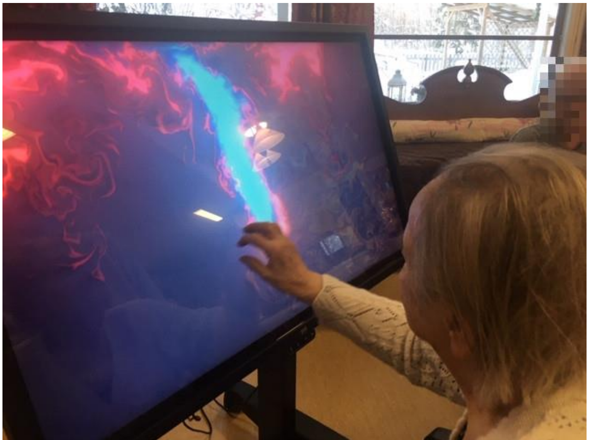
Kuva 4: Musiikkimaalausta yetipadilla

Konginkankaan palvelutalon kaksiviikkoisen residenssin aikana taiteilija oli paikalla 7 päivänä. Tänä aikana järjestettiin yhteensä 18 erilaista tuokiota, joihin osallistuttiin 120 kertaa. Näistä 11 oli ryhmätuokiota, 1 yksityistuokio sekä 6 muuta tapahtumaa /elävän musiikin hetkeä. Päättyjäiset järjestettiin pe 12.2. Päättyjäisilaisuudet olivat osittain tavallisen ryhmäkohtaamisen mukaisia. Juhlavuutta toivat elävät musiikkiesitykset ja pieni päättyjäispuhe.