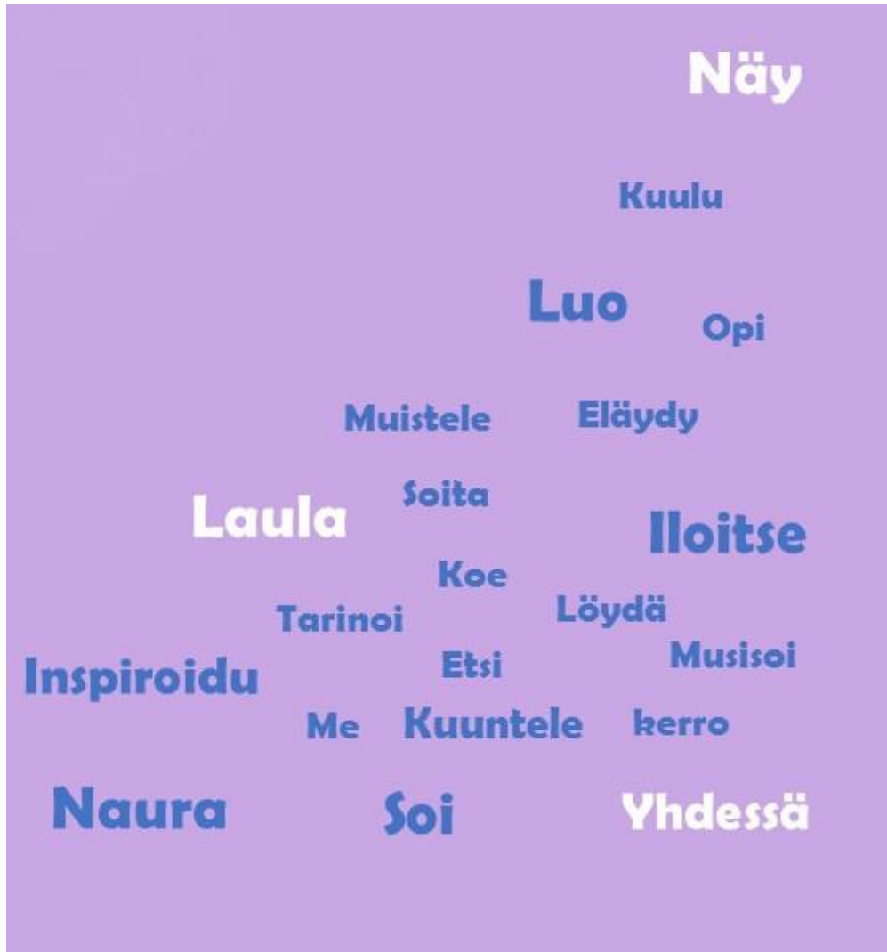
Kuva 1: Sanakollaasi Äänemme Soi -projektin tavoitteista

Äänemme Soi –projekti on musiikkikasvatuksellinen projekti, joka suunnattiin Äänekosken kaupungin palveluasumisen yksiköissä asuville vanhuksille ja varhaiskasvatuksessa oleville lapsille. Projektissa sovellettiin mm. Taiteen keskuksen ”Taiteen käytön, hyvinvoinnin ja osallistamisen kehittämissuunnitelman” kokoamia havaintoja, kokemuksia ideoita, menetelmiä ja sovelluksia. Projektin osa-alueita olivat kaksi-kolmeviikkoiset residenssijaksot vanhuspalveluyksiköissä ja päiväkotilapsille suunnatut osallistavat musiikkiesitykset.