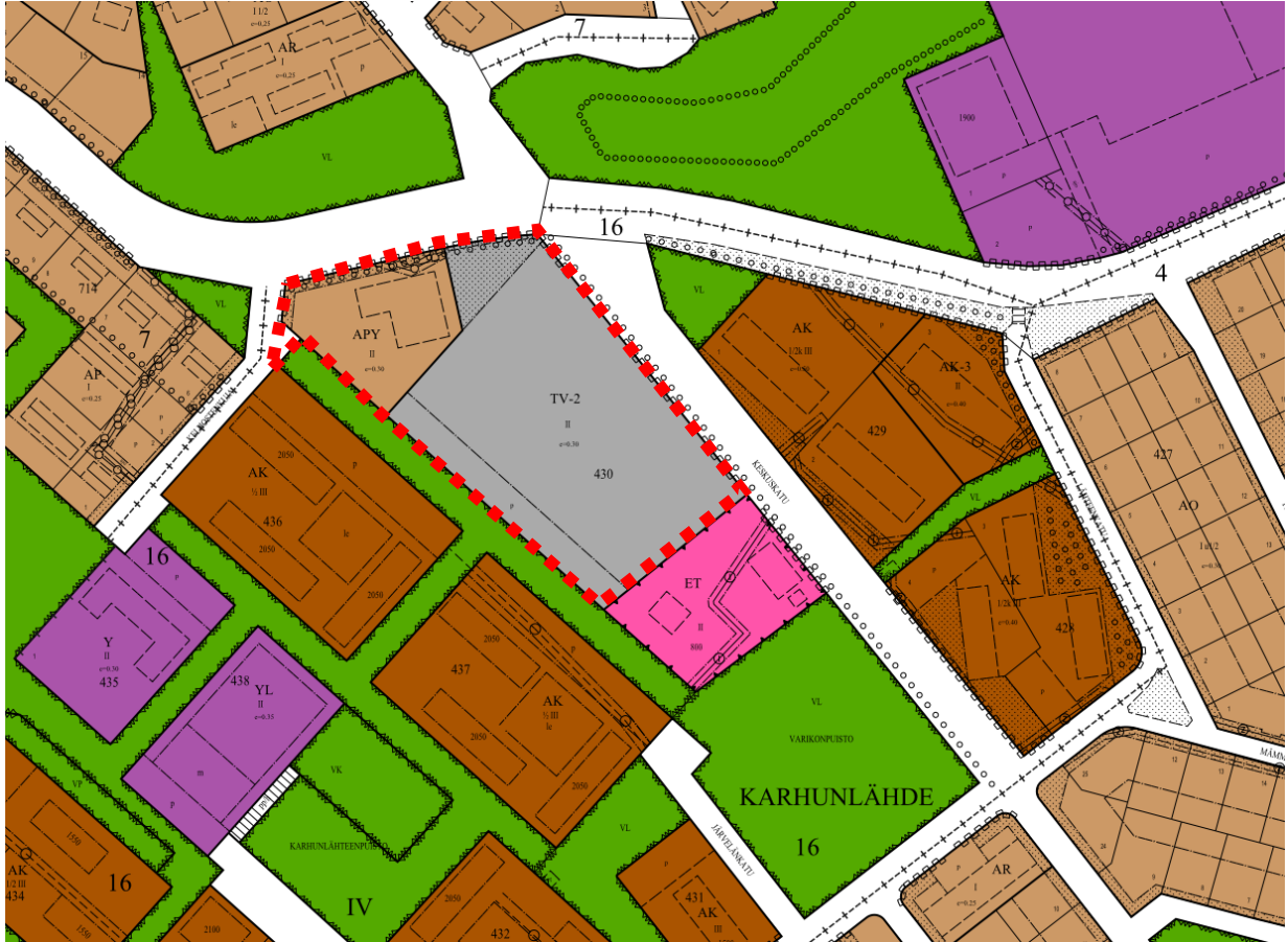
Kuva 4. Ote ajantasa asemakaavasta. Suunnittelualue on rajattu punaisella.

Voimassa olevassa asemakaavassa suunnittelualueelle on osoitettu pääosin varastorakennusten korttelialuetta (TV-2), jolle saa sijoittaa ympäristöhäiriöitä aiheuttamatonta toimintaa. Kortteliin voidaan sijoittaa myös pääkäyttötarkoitusta palvelevia liike- ja toimistotiloja. Lisäksi suunnittelualueelle on osoitettu luoteiskulmaan asuinpienalojen ja yleisten rakennusten korttelialuetta (APY) sekä pieni määrä kaualuetta. Rakennusoikeus on osoitettu tehokkuusluvulla e=0.30 .