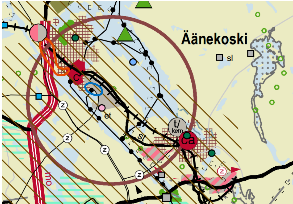
Kuva 1. Ote tarkistetusta Keski-Suomen maakuntakaavasta. Kaavoitettavan alueen sijainti on osoitettu sinisellä soikiolla.

Alue rajautuu länsipuoleltaan aluevaraukseen, jolle on osoitettu seudullisesti merkittävän tiivistetävän taajaman aluetta. Koko suunnittelualue sijoittuu laajaan kulttuuriympäristön vetovoima-alueeseen. Äänekoski on osoitettu maakuntakaavassa seutukeskukseksi.