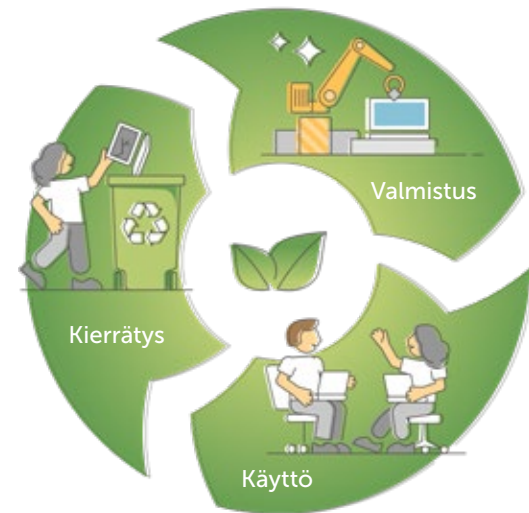
Kaavio 2. Kiertotalouden toimintamalli.

Kuluttaminen kuluttaa ympäristöä myös kirjaimellisesti. Kulutuksen vähentäminen onkin merkittävä kestävä elämää tukeva ympäristöteko, johon sinulla on mahdollisuus vaikuttaa. Kiertotaloutta tukevilla ratkaisuilla voidaan pidentää materiaalin, tuotteen tai muun hyödykkeen elinkaarta. Tällöin materiaalin elinkaari ei pääty pois heittämiseen, vaan kaikki käytöstä poistettu aines hyödynnetään uudelleen. Lisäksi reilu ja toimiva kiertotalous edistää sosiaalista hyvinvointia, jossa osallistumisen mahdollisuudet lisääntyvät.