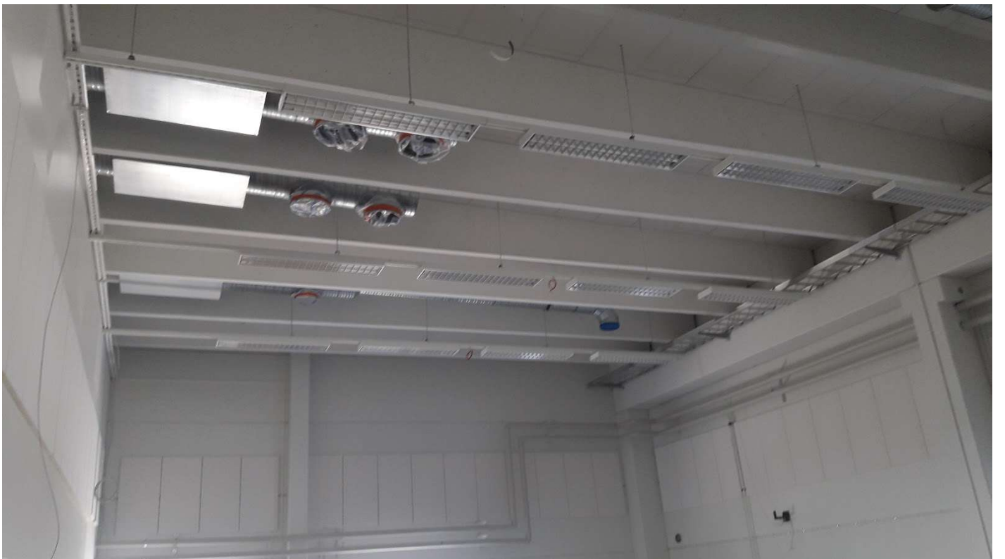
Tanssisalin katossa on uudet IV kanavat.