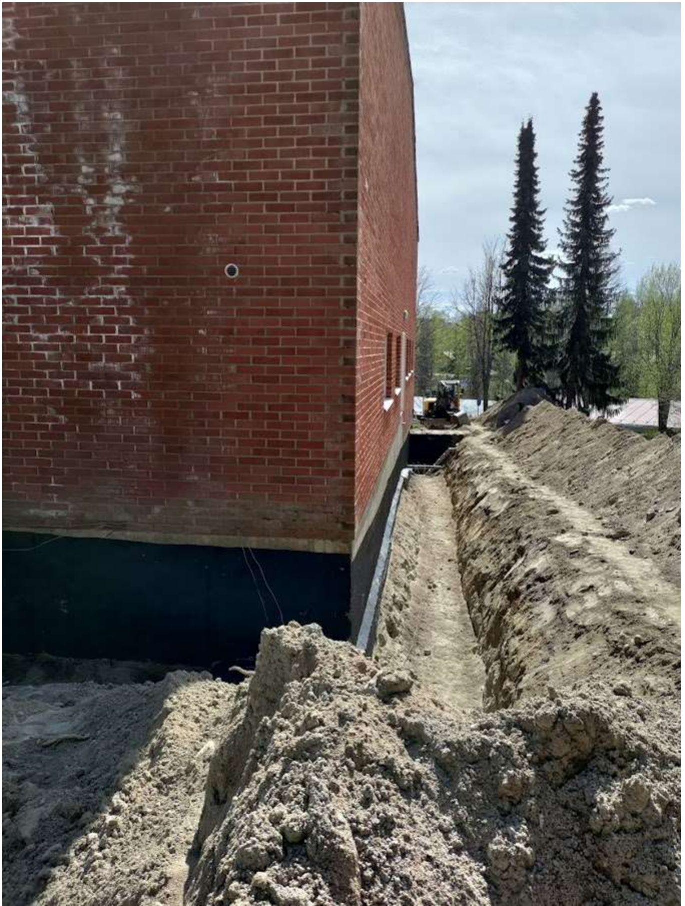
Rakennuksen ympäryskaivu aloitettu. Sokkelin vesieristys aloitettu. Salaoja putkea menee noin 260m ja salaojakaivuja 17 kpl sekä vesieristys huopaa 400m 2 eli 26 rullaa.