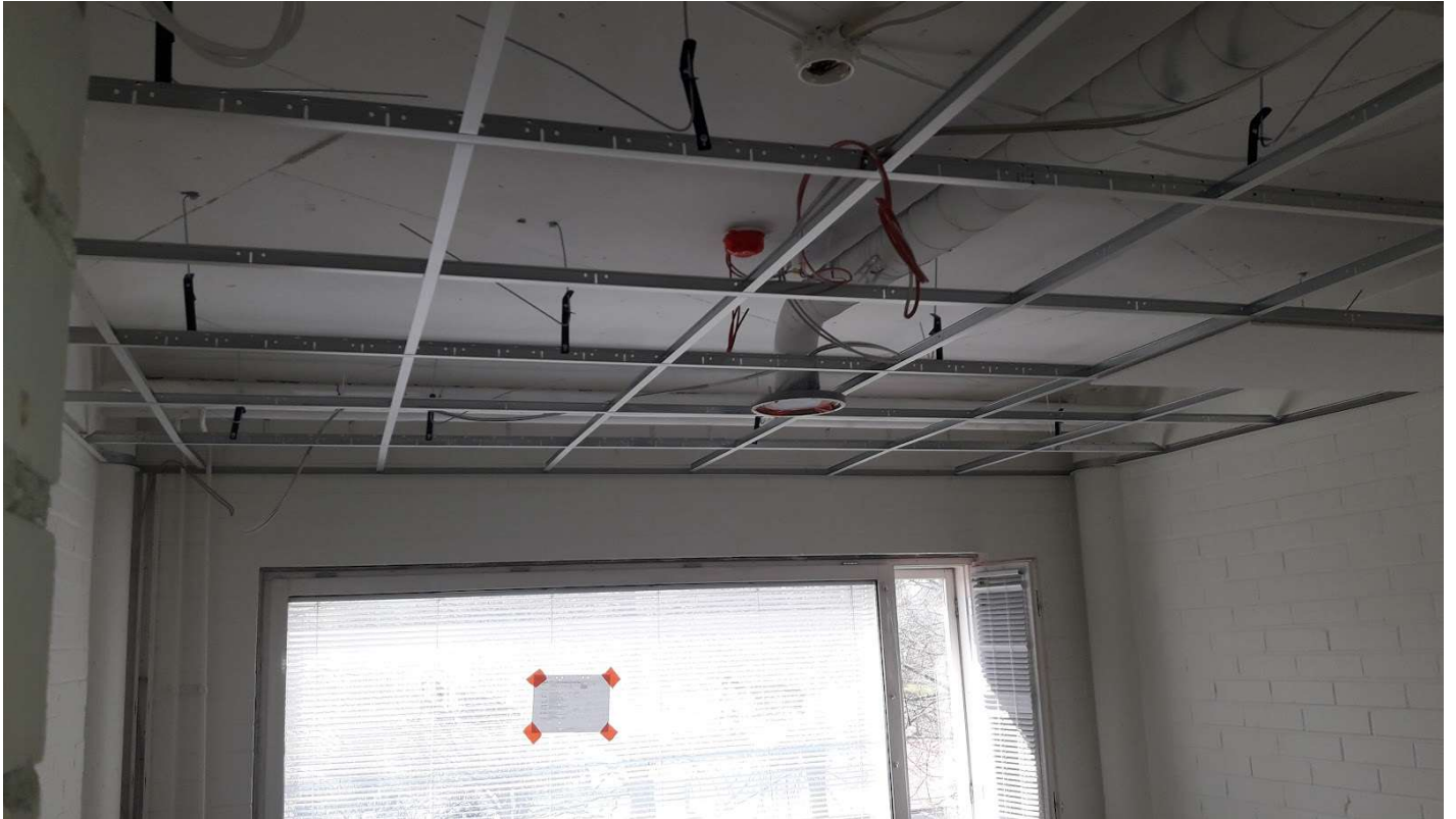
Alakattorungot 2 krs toimistoissa.

Työvaiheet: Vesikaton vedeneristystyöt jatkuu, seinälaatoitukset kosteat tilat jatkuu, maarakennustyöt aloitettu ja sääsuoja purettu. Alakattotyöt aloitettu 2 krs.